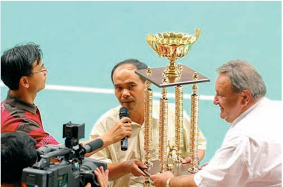
Vedoucí týmu vietnamských tenistů ze SRN děkuje za získání „Poháru přátelství ČVS“. Đội trưởng những vận động viên tennis Việt Nam từ LB Đức cảm ơn vì nhận được „Cúp hữu nghị ČVS“.

cũng có sự tham gia của người Việt Nam tại nhiều nước EU và cả từ Việt Nam. Hoạt động này do Hội người Việt Nam ở Cộng hoà Séc và Câu lạc bộ Tennis người Việt Nam ở Praha tổ chức.